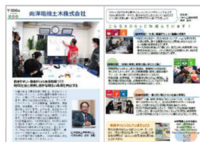
<最上位 (Supreme) の掲載例>

▼全ての取組紹介シートは以下HPで閲覧可能です。(全認証事業者を対象に引き続き募集し更新予定)