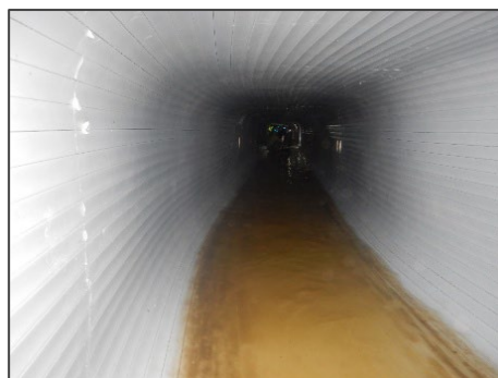
管更生工法による対策例