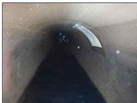
部分修繕による対策例