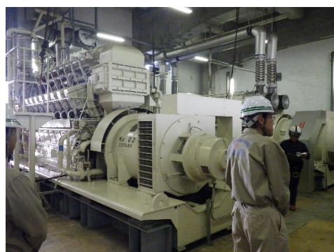
自家発電設備等の手動運転