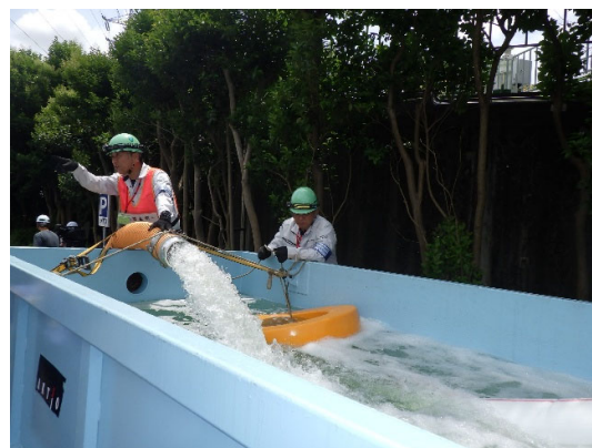
協働による合同訓練