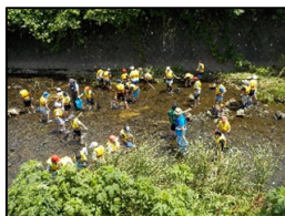
帷子川での魚とり、生き物観察の様子