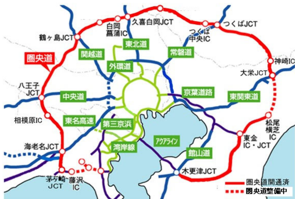
首都圏中央連絡自動車道)概略図