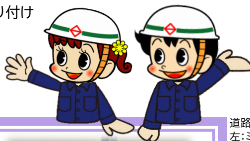
道路局マスコットキャラクター 左:ミチルちゃん 右:ミチローくん