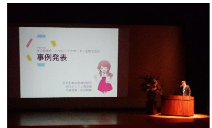
事例発表の様子（令和4年度）