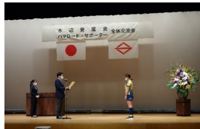
表彰式の様子（令和4年度）

港南公会堂（港南公会堂棟2階） 〒233-0004 横浜市港南区港南中央通10-1 TEL 045-847-8480