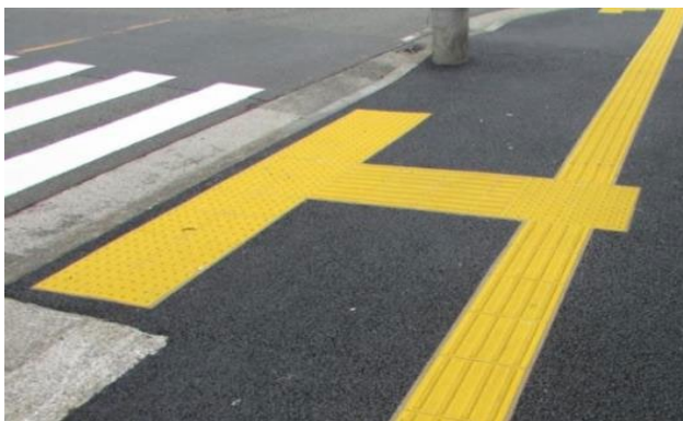
〈視覚障害者誘導用ブロックの設置イメージ〉