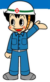
道路局マスコットキャラクター ミチローくん

横浜市では、市内の歩道橋を対象にネーミングライツの提案を募集しています。 このたび、下記1橋に関する提案がありましたので、「横浜市ネーミングライツ導入に関するガイドライン」に基づき、市民の皆様から提案内容についてのご意見を募集します。 なお、皆様からいただいたご意見は、今後の事業の参考にさせていただきます。