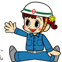
道路局マスコットキャラクター ミチルちゃん