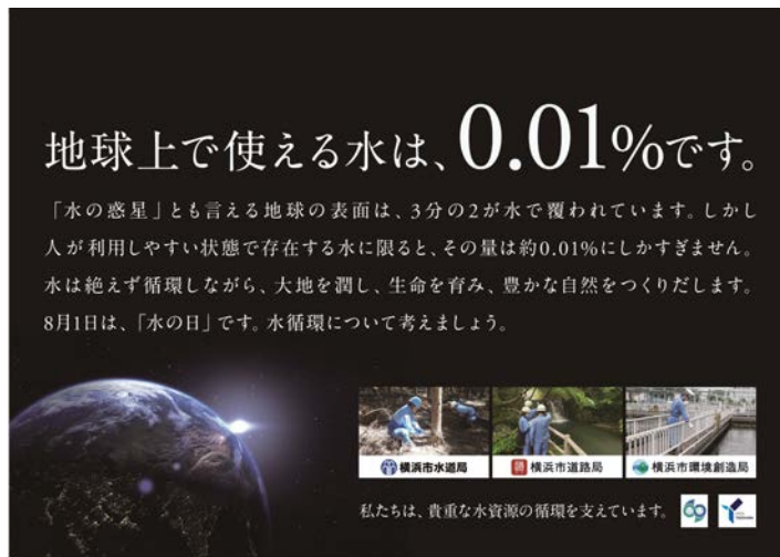
↑横浜駅・市営地下鉄車内用広告（イメージ）

横浜市では「水の日」にあわせて、水循環に関連する事業を行っている水道局、環境創造局、道路局の3局合同で、私たちが使える水が貴重であることや水循環の大切さについて考えていただく機会の一助となる水循環啓発広告を作成し、横浜駅や市営地下鉄、市庁舎に掲出します。