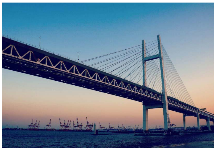
横浜ベイブリッジ