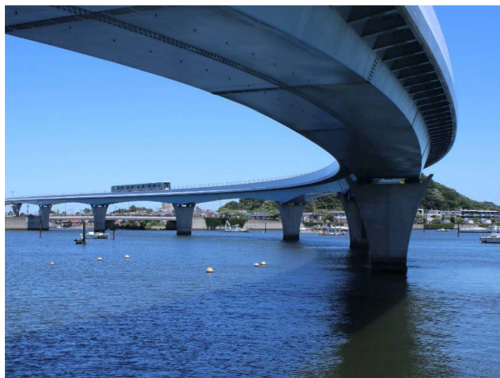
シーサイドライン