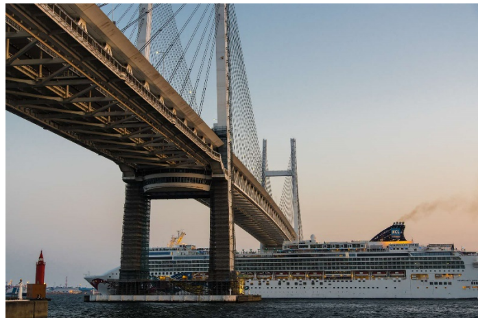
【横浜の橋賞】客船ベイブリッジをくぐる！