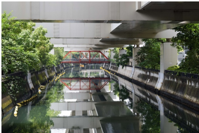
【道路局長賞】中村川に映える赤いトラスの浦舟水道橋