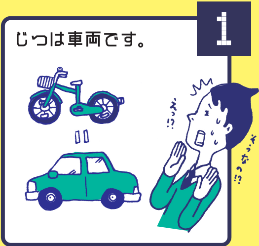
自転車は、車道が原則、歩道は例外