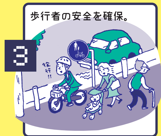
歩道は歩行者優先で、車道寄りを徐行