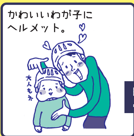
子どもはヘルメットを着用