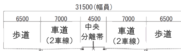
【川向線標準横断面図】

道路名：都市計画道路川向線（市道東方町第342号線） 場所：都筑区東方町及び川向町 延長：約 890m 標準幅員：31.5m（車道4車線、両側歩道） 事業年度：平成24年度～令和3年度 総事業費：約 68 億円