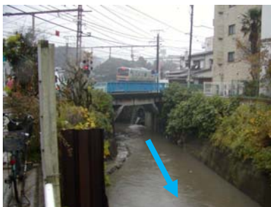
旧金沢橋（下流側から）