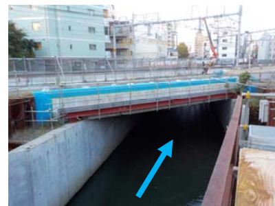
新水路（上流側から）