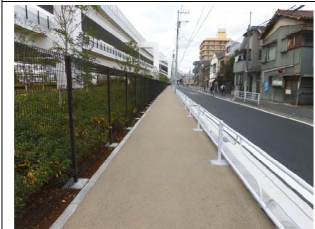
写真 5 : 歩道整備状況