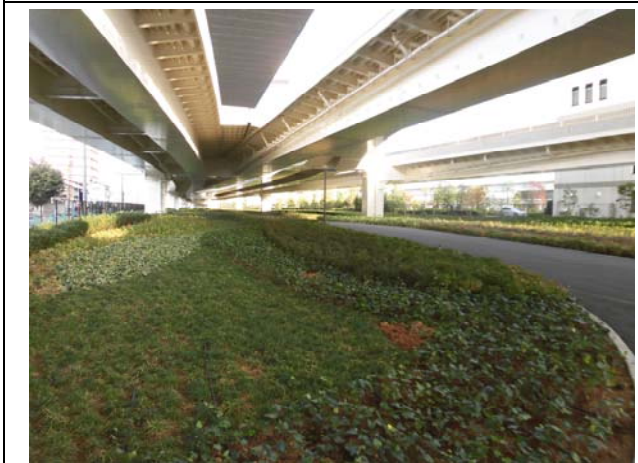
写真 3 : 高架下緑地