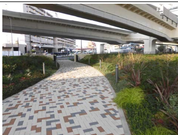
写真 2 : 高架下緑地