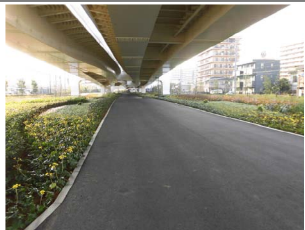
写真 4 : 高架下緑地