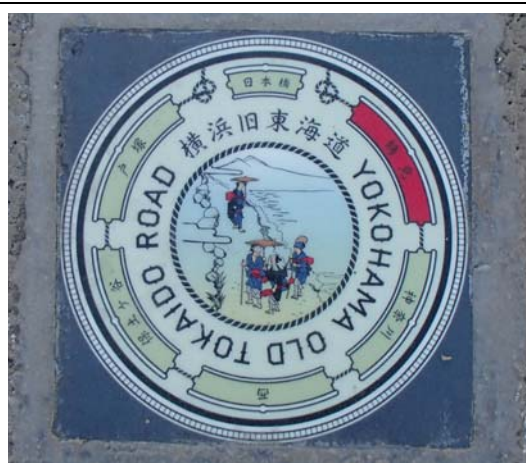
写真 6 : 旧東海道を示すサイン