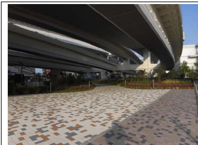
写真 1 : 高架下緑地