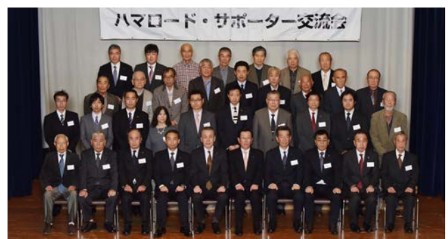
昨年の交流会の様子

地域の身近な道路を対象に、地域のボランティア団体と行政が協働して、道路の美化や清掃等を行う制度です。地域の自治会や学校、商店街及び地元企業等、市内で 456 のボランティア団体が活動しています。