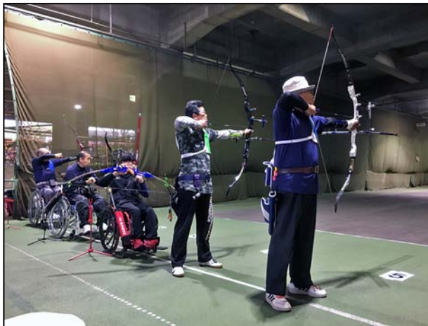
〈アーチェリーの様子〉