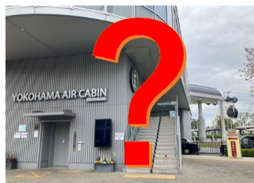
実施場所ごとのデザインは 行ってからの楽しみ！