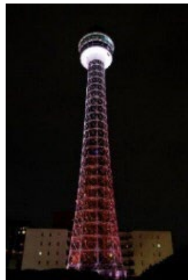
横浜マリンタワー