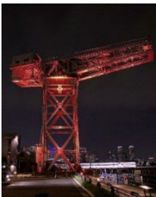
ハンマーヘッドクレーン

※ 今後変更となる可能性があります。最新情報は特設 WEB サイトでご確認ください。