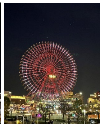
大観覧車「コスモクロック 21」