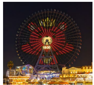
※ 画像はイメージです。

さらに、以下施設で東方神起公式カラーの赤色の特別ライトアップを実施します(再掲)。