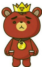
東方神起ファンクラブ 公式キャラクター 「TB」

さらに、横浜中華街では、TB たちが街で“かくれんぼ”している「隠れスポット」も。是非探してみてください！