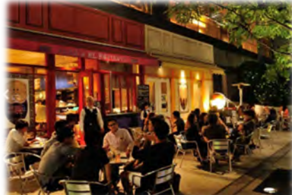
ロケーションを活かしたテラス席