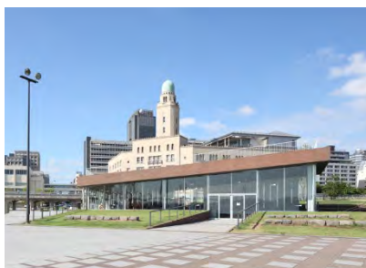
象の鼻テラス（外観）