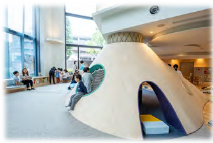
子どもも大人も非日常を味わえる空間