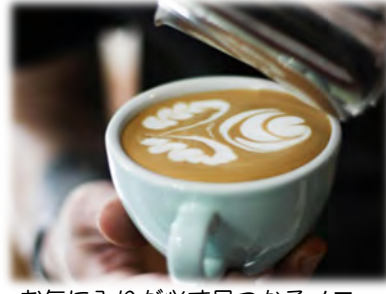
お気に入りが見つかるメニュー展開