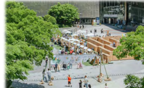
象の鼻パークや屋上スペースの一体的活用