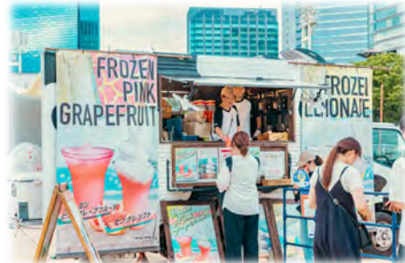
イベント等と連動した飲食提供