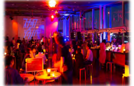
幅広い時間帯でのプログラム展開