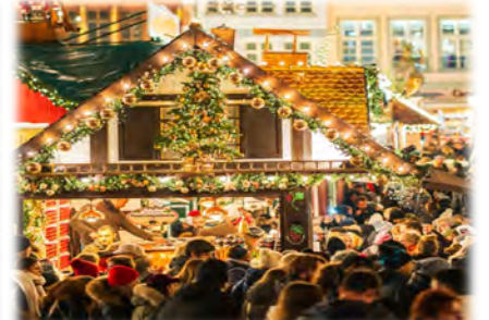
周辺イベントや施設との連携