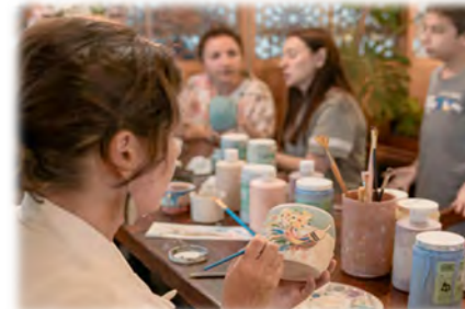
趣味やライフスタイルなど多様なプログラム