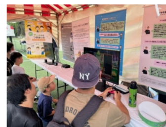
区民まつりでのeスポーツ体験