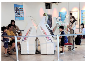
市役所でのeスポーツPR展示