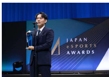
日本eスポーツアワードの誘致