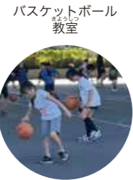
バスケットボール教室