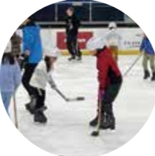
アイスホッケー教室