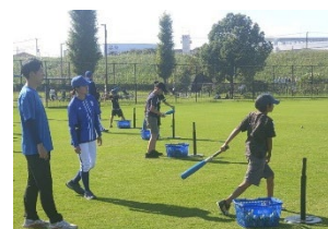
<小学生スポーツ教室>

https://shinsei.city.yokohama.lg.jp/cu/141003/ea/residents/procedures/apply/131f76b1-647f-4ab7-ba6b-26dc5aa6e25d/start