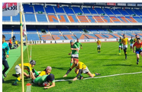
昨年度大会の様子（第 17 回大会）