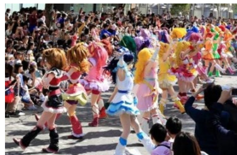
横浜みなとみらいプリキュア パレードの様子（2018年）

※詳しくはプリキュアシリーズ公式ポータル https://anime-precure.com/