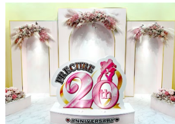
全プリキュア展～20th Anniversary Memories～ 展示モニュメント

https://www.toei-anim.co.jp/all_precure_exh/