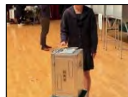
※昨年度の模擬投票の様子