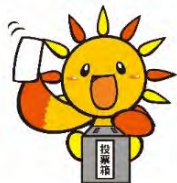
旭区マスコットキャラクターあさひくん