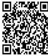
X (旧 Twitter)