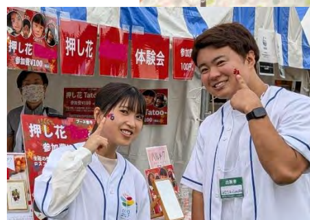
▲押し花ワークショップイメージ▲ (フェイスアート・カードづくり)