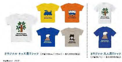
オリジナル キッズ用Tシャツ (2種(100cm/120cm) - ¥2,500(税込))