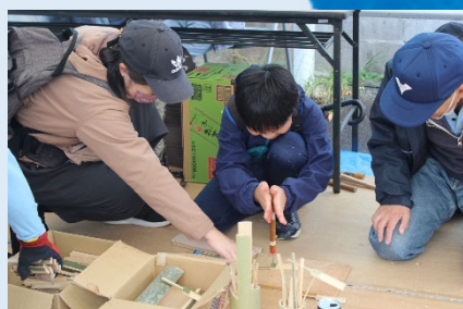
区民まつりで 竹を使った工作を体験