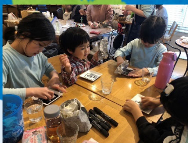
水の力でお掃除体験