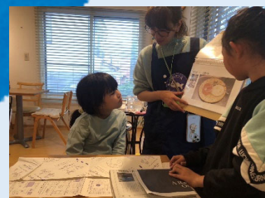
環境にやさしい 簡単なひと手間を学習