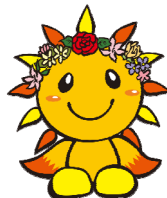
旭区マスコットキャラクター あさひくん