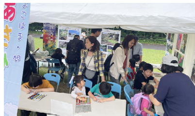
▲昨年の旭区出展ブース▲