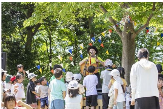
前回開催時のイベントの様子