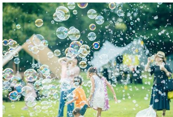
シャボン玉パフォーマンス（イメージ）