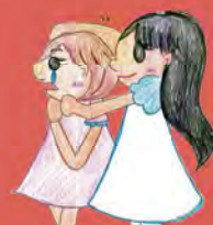
イラスト: ピアジョブサポート