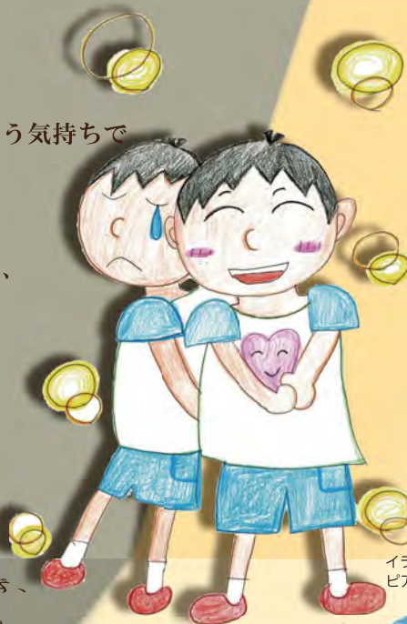
イラスト: ピアジョブサポート