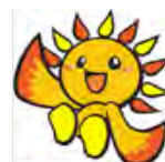
旭区マスコットキャラクター あさひくん