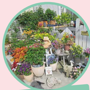
個人宅の庭・プランター

令和8年 4月3日(金) ~ 4月16日(木) 4月20日(月) ~ 5月7日(木)