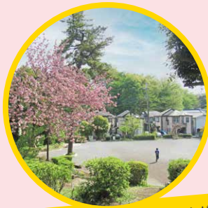
公園愛護会等、地域の皆さんが 管理している花壇・プランター