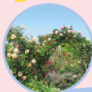
地域の団体、商店、企業等の 庭・花壇・プランター