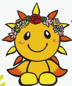
旭区マスコットキャラクター あさひくん