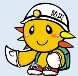
旭区マスコットキャラクター あさひくん

ご自身の組織の活動を考えるにあたり他の町の防災組織の取組を参考にしたい方や、防災に関心のある学生の方は個人向け形式の研修がおすすめです。