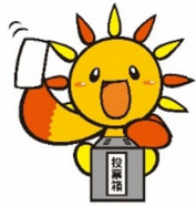
旭区マスコットキャラクターあさひくん