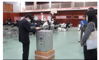
星槎高等学校での投票の様子