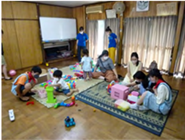
子育てサロンで未就園児と遊ぶ