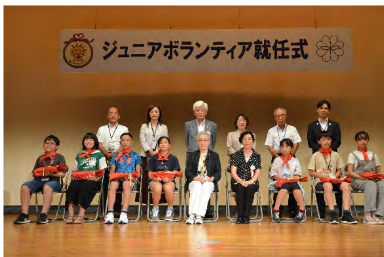
令和4年度の就任式の様子