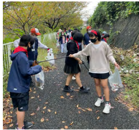
清掃活動 ゴミ拾い