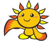
旭区マスコットキャラクター あさひくん

あっぱれフェスタとは、旭区地域自立支援協議会の主催による障害に関する普及啓発を目的としたイベントです。