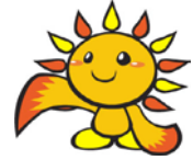
旭区マスコットキャラクター あさひくん

あっぱれフェスタとは、旭区地域自立支援協議会の主催による障害に関する普及啓発を目的としたイベントです。