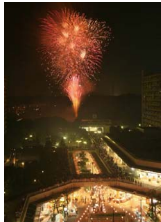
←花火募金を募り、例年2000発を越える花火を打ち上げている（祝若葉台連合自治会25周年）