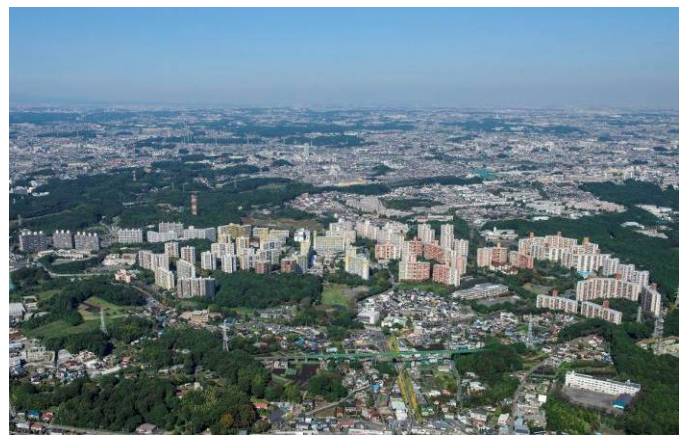
↑横浜若葉台の俯瞰写真

そのため、地域住民等（自治会・管理組合・NPOなど）や関係団体で今後の取組事項などについて検討を行い、平成29年3月に『横浜若葉台みらいづくりプラン』としてまとめ、12月に取組を具体化するための『横浜若葉台みらいづくりプラン推進会議』を立ち上げました。