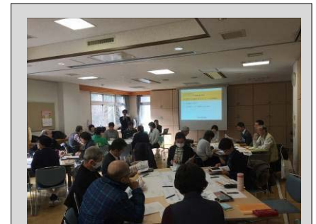
【先行実施した取組】

企業と連携したモデル事業の実施など、I・TOP 横浜や環境未来都市推進プロジェクトを活用した地域経済活性化などについて検討します。