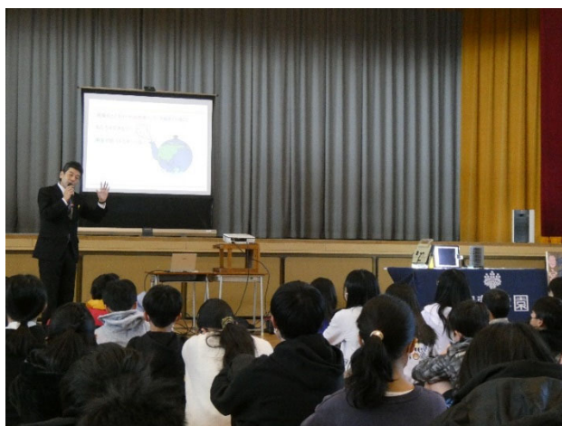
令和 5 年度に試行実施した出前授業の様子 (横浜市立さつきが丘小学校 6 年生向けの授業)