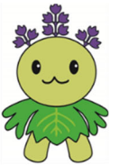
桐蔭学園マスケット キャラクター きりりん