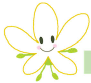
青葉区マスケット キャラクター なしかちゃん