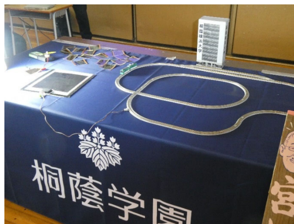
ペロブスカイト太陽電池で発電した鉄道模型を走らせます。