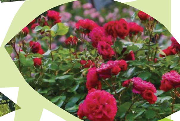
ローズガーデンのバラ