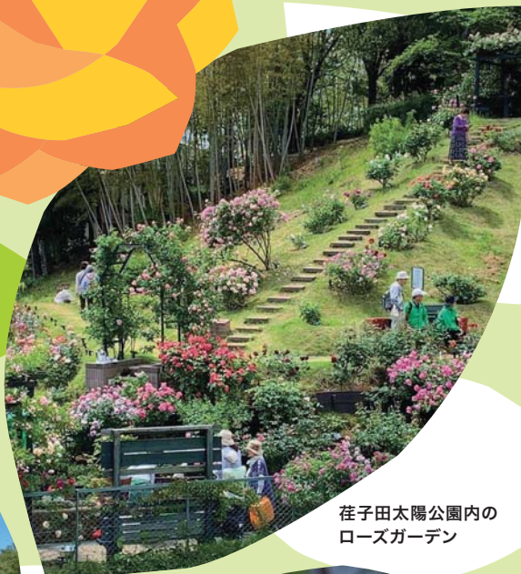
荇子田太陽公園内の ローズガーデン