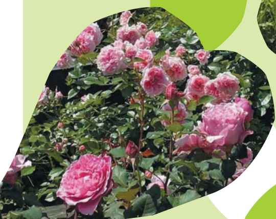
ローズガーデンのバラ

お問合せ◎青葉区制30周年記念事業実行委員会 (事務局: 青葉区区政推進課企画調整係)