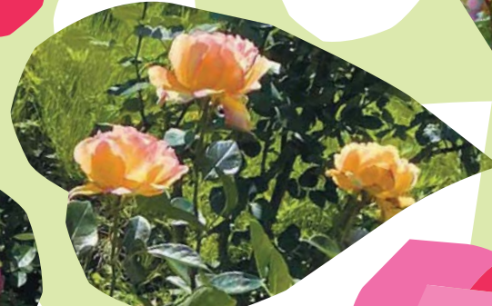
ローズガーデンのバラ