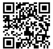
たまプラーザ テラス HP

10月のフードロス削減月間にあわせて、ひとにも環境にもやさしい商品を販売するマルシェを開催。フードロスについて学ぶお子さま向けのワークショップも同時開催します。詳細は、たまプラーザ テラス HP をご覧ください。