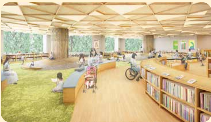
▲こどもフロアのイメージ