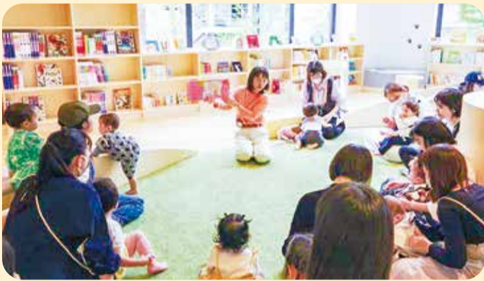
▲おやこフロアでのおはなし会