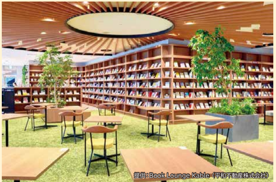
▲ブックス&ラウンジ(仮称)のイメージ