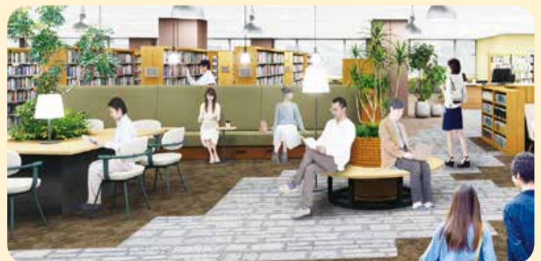
▲リノベーションのイメージ