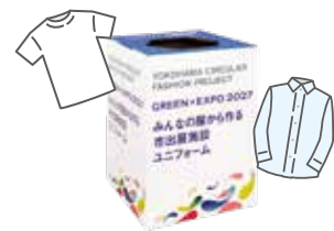
回収ボックスに服を入れる