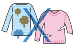
濡れた服、汚れた服、 破れた服