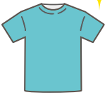
ユニフォームの完成