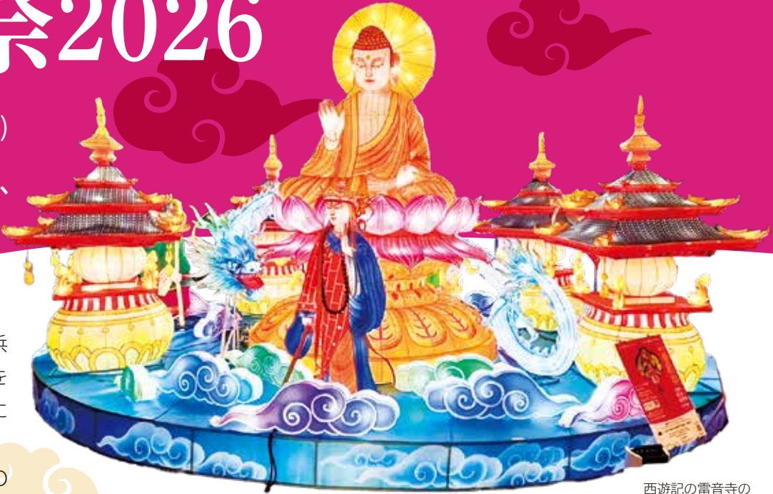
西遊記の雷音寺のランタン(イメージ)