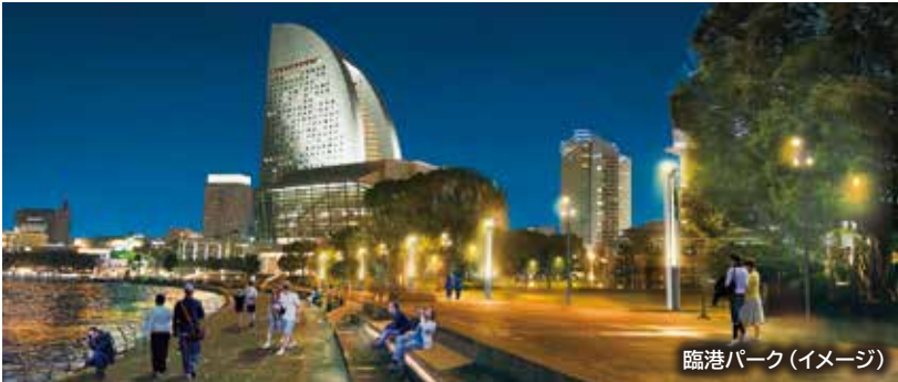
臨港パーク(イメージ)

臨港パークから山下公園へと続く約5kmの海辺は、日中、ジョギングや散歩、家族での憩いのひとときなど、思い思いの時間を楽しむ人たちが賑わっています。夜景が美しい夜の時間帯もより楽しんでもらえるよう、快適な歩行空間や夜間照明を整備し、横浜の水際線の魅力をさらに高めていきます。