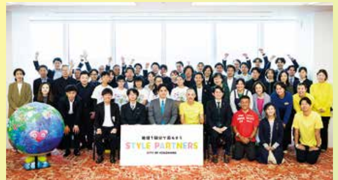
▲STYLE PARTNERS スタートイベント(10月27日)