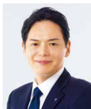
横浜市長 山中竹春