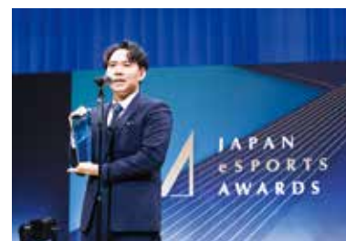
昨年の授賞式の様子▲