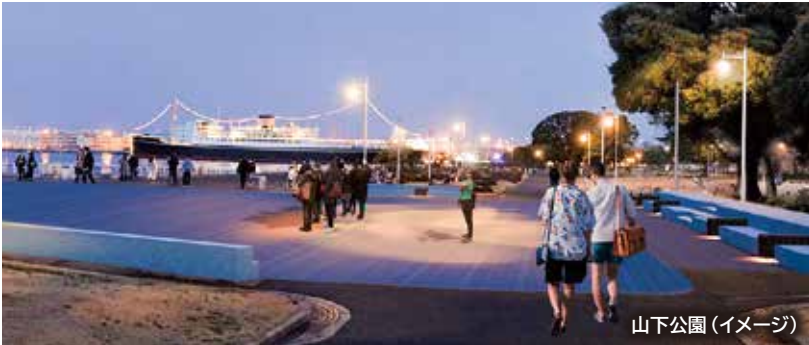
山下公園(イメージ)

問合せ にぎわいスポーツ文化局にぎわい創出戦略課 ☎045-671-4041 ☎045-550-4688