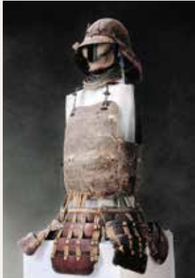
▲伝・北条氏信使用の甲冑 個人蔵 小田原城天守閣保管