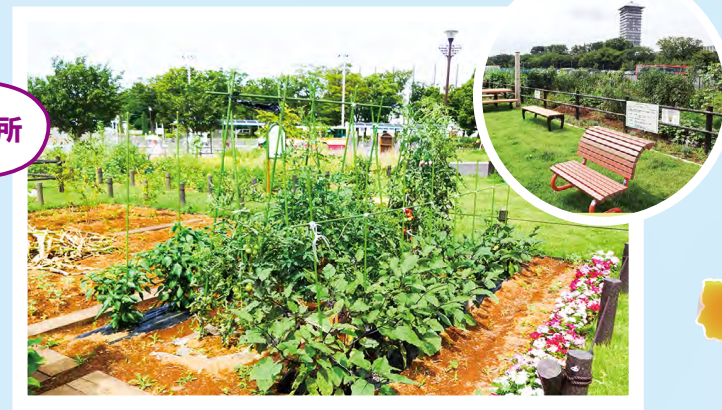
▲深谷町ふれあい公園

公園内に自分で好きな野菜を育てて収穫できる農園を設置しています。今後、中区の本牧山頂公園も新たに加わる予定で、農地の少ない都心部でも、多くの人が農体験できる機会を広げていきます。