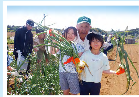
▲都岡地区恵みの里