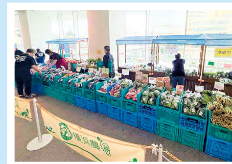
▲横浜野菜直売所 (市役所直売)