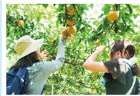
▲果物のもぎとり体験