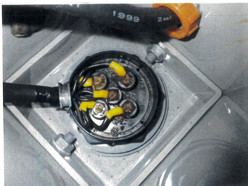
高架水槽NO.1 電極保持器錆