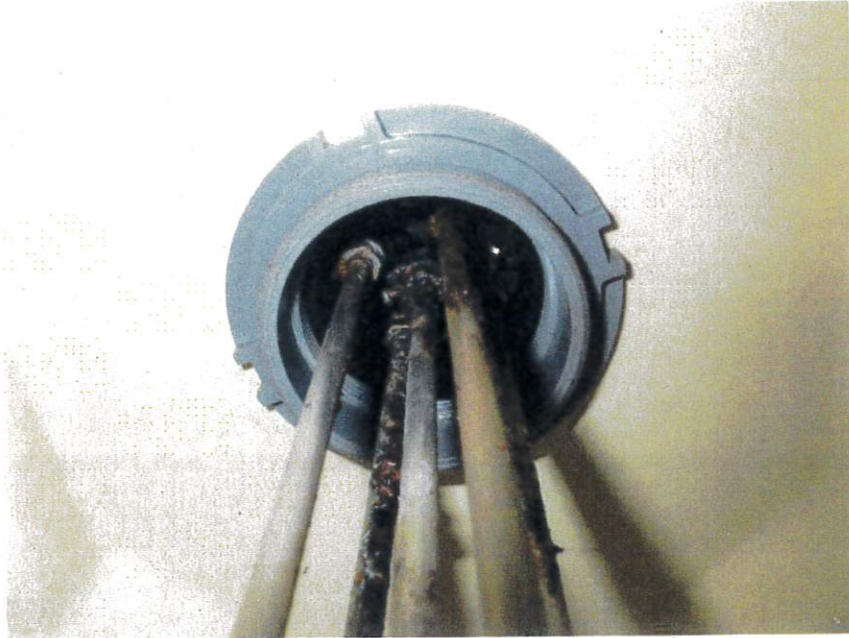
高架水槽NO.2 電極棒錆