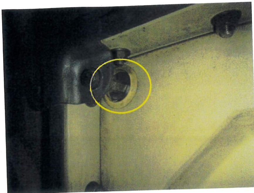
受水槽NO.2側 側面部漏水 (ズーム)