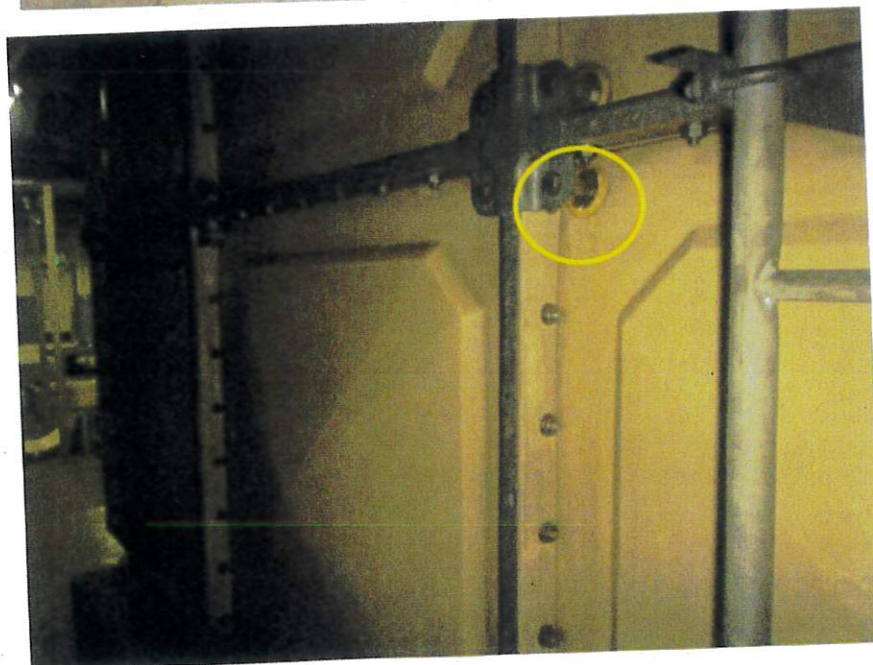
受水槽NO.2側 側面部漏水