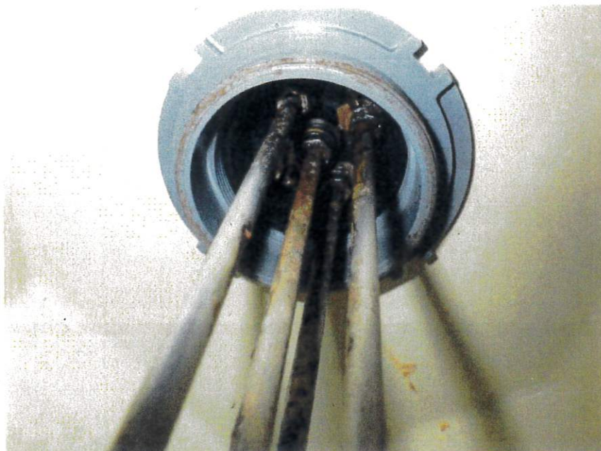
高架水槽NO.1 電極棒錆