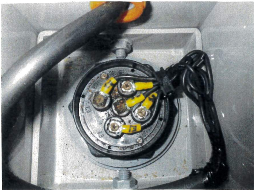
高架水槽NO.2 電極保持器錆