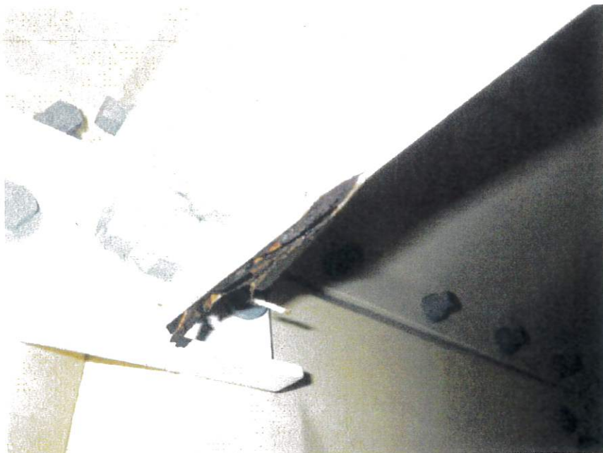
高架水槽NO.2 槽内補強材錆