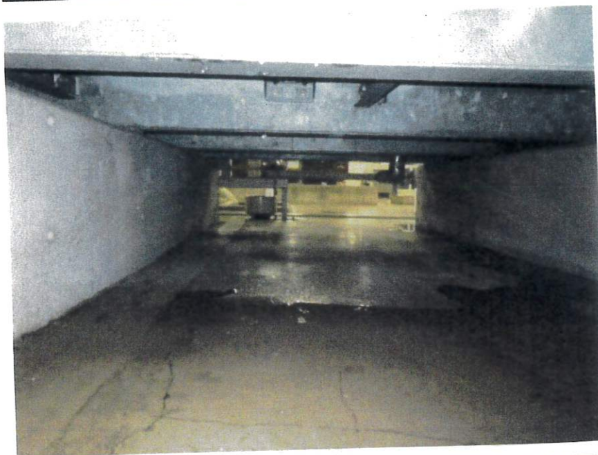
受水槽下部 作業中漏水 (作業後止水)