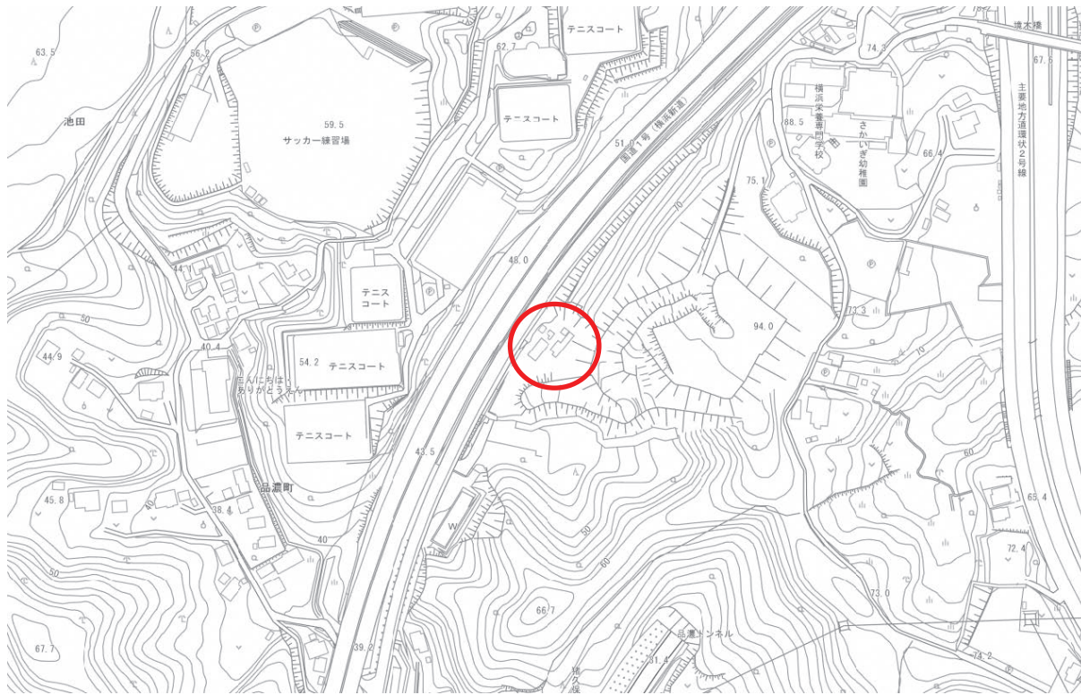
戸塚区品濃町最終処分場 所在地 横浜市戸塚区品濃町1622番地