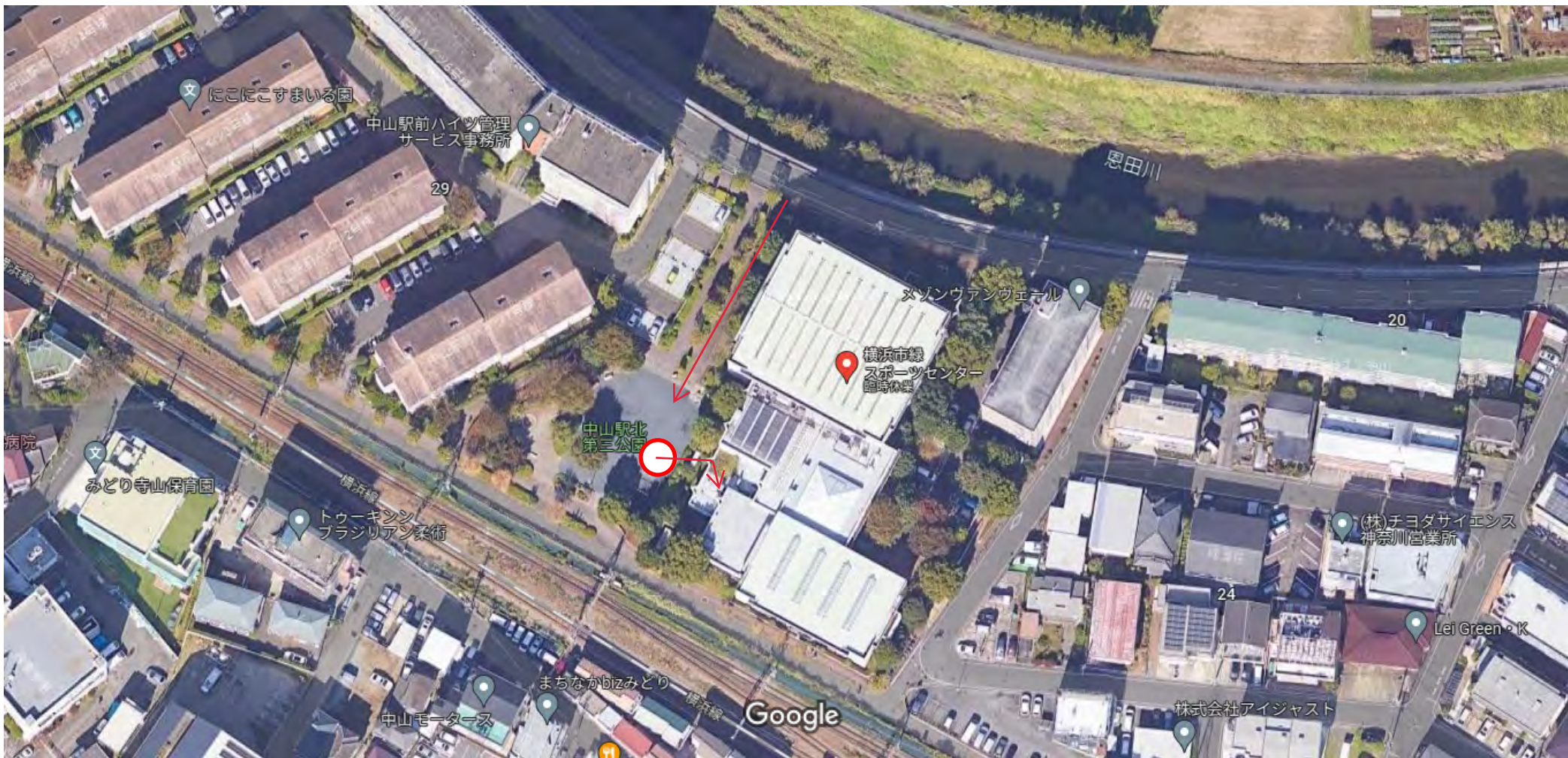
画像 ©2024 Airbus、Digital Earth Technology、Maxar Technologies、地図データ ©2024 20 m