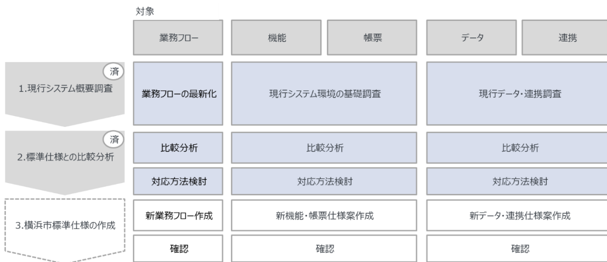
図 3 これまでの取り組み