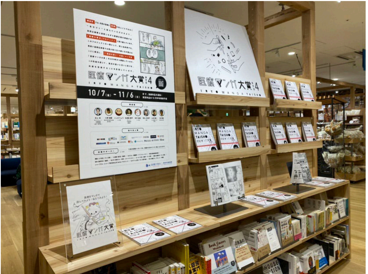
(無印良品コレットマーレみなとみらい店 2022年10月) 第1回受賞作マンガ冊子、事業紹介パネルの展示、チラシの配布