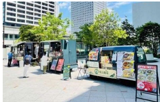
キッチンカー（北プラザ）