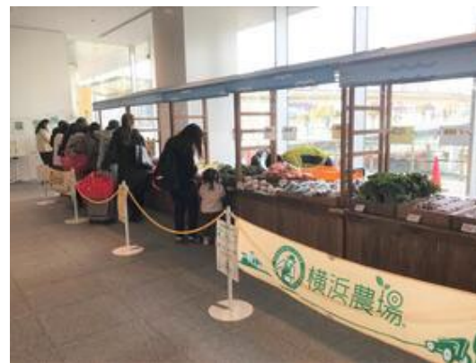
販売（多目的スペース）