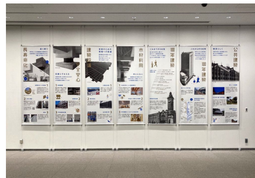
展示（展示スペースC）